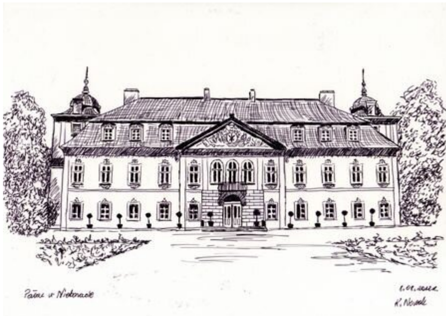
Pałac w Nieborowie - rys. Kinga Nowak (źródło: parkilodzkie.pl)

data aktualizacji: 2019.07.04 autor: Redakcja