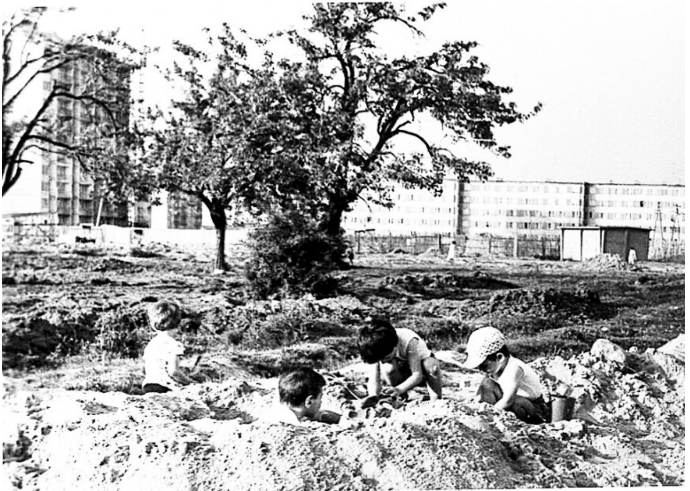
Sad, którego pozostałości do niedawna można było znaleźć na placu z siłownią przy Wańkowicza/Szarych Szeregów.

data aktualizacji: 2019.07.15 autor: Redakcja