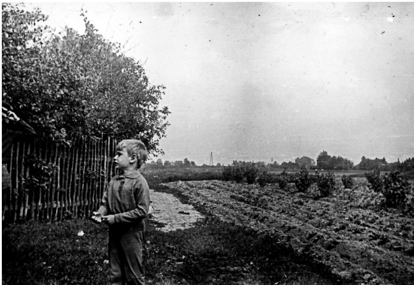
Zabudowania gospodarstwa w miejscu gdzie później stanęła Szkoła Podstawowa nr 8.

Ciekawe zdjęcia uratowali Państwo Wąsińscy z rozbieranego budynku starego CPN-u. Możemy zobaczyć na nich szczerze pola okalające stację oraz bazę ciężkiego sprzętu.