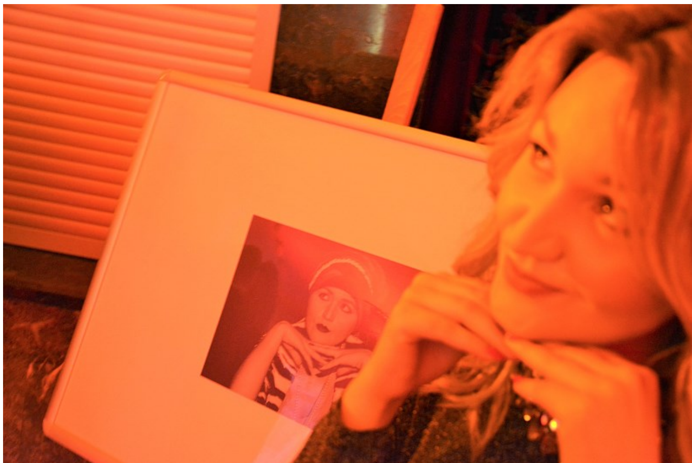
Modelami byli pracownicy CKŻ.