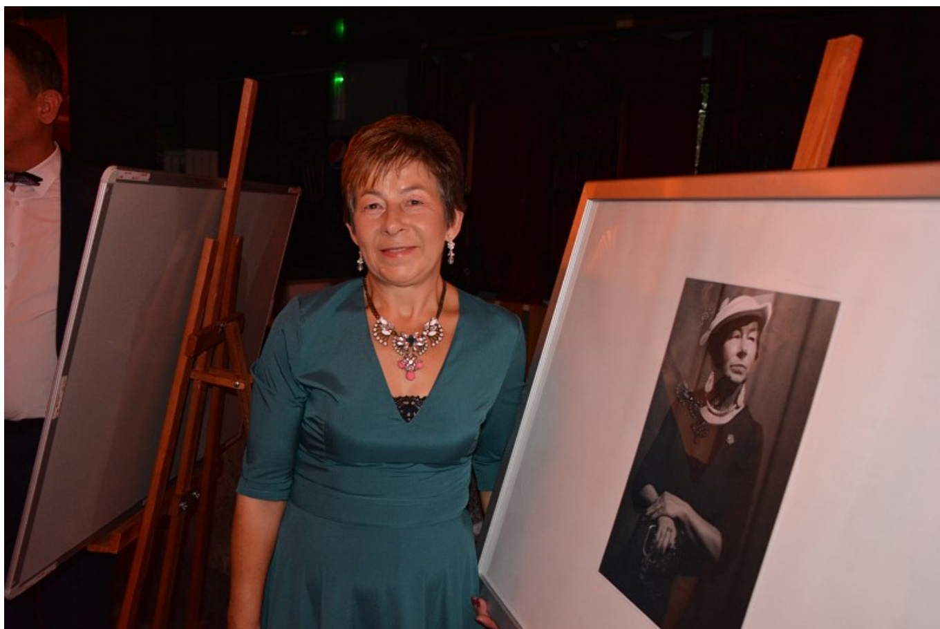
"Ale Gala" przyciągnęła tłumy. Było winno, czerwony dywan.