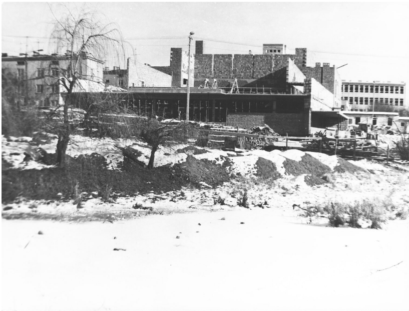
Budowa kinoteatru Polonez. To jedna z dłuższych skierniewickich budów. Prezentowane zdjęcie zrobiono zimą 73/74, a inwestycję oddano dopiero 17 stycznia 1978 roku.