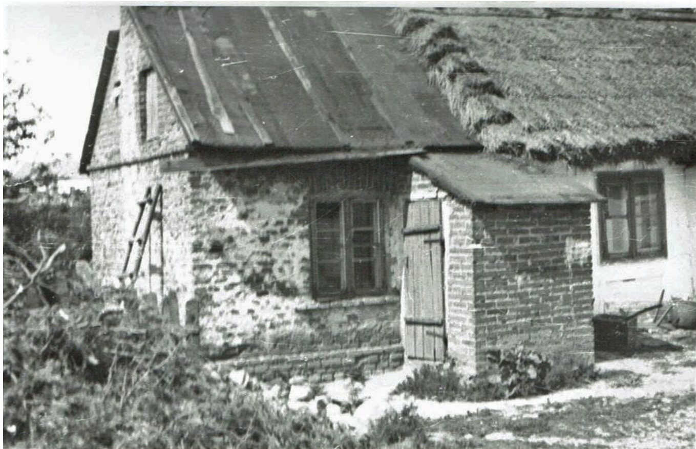
Budynek przy ulicy Polnej w Rawie, w którym znajdowała się powielarnia, 1946 r.