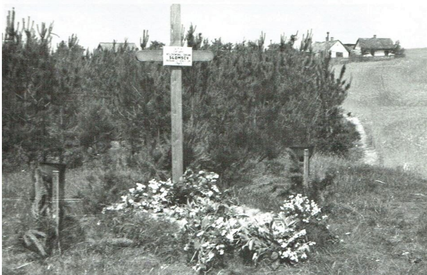
Pierwsza mogiła braci Świderskich (Ślomskich) urządzona przez mieszkańców Rawy, 1946 r.