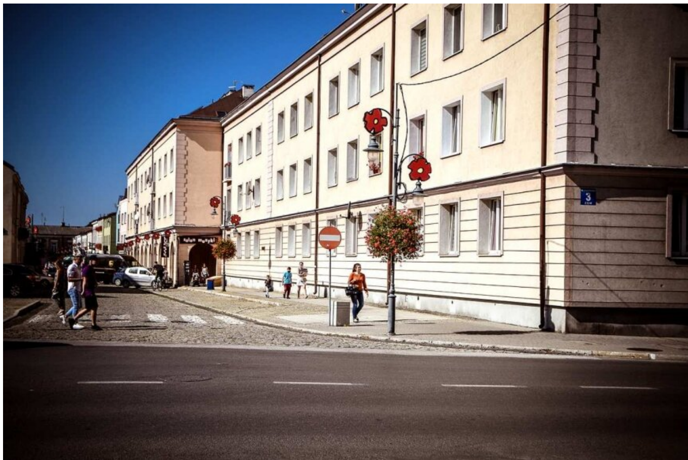
Ulica Żwirki w Skierniewicach.

data aktualizacji: 2020.09.14 autor: Sławomir Burzyński